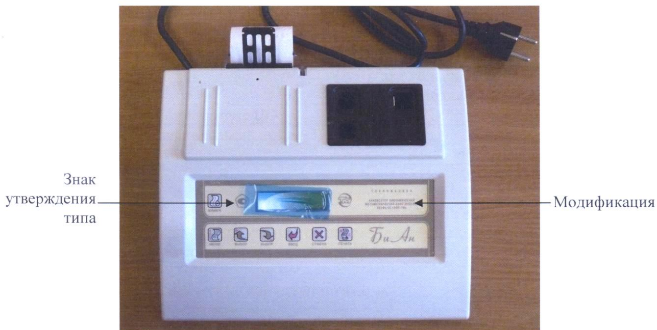
Рисунок 1 – Общий вид Анализаторов биохимических фотометрических кинетических АБхФк-02-«НПП-ТМ»