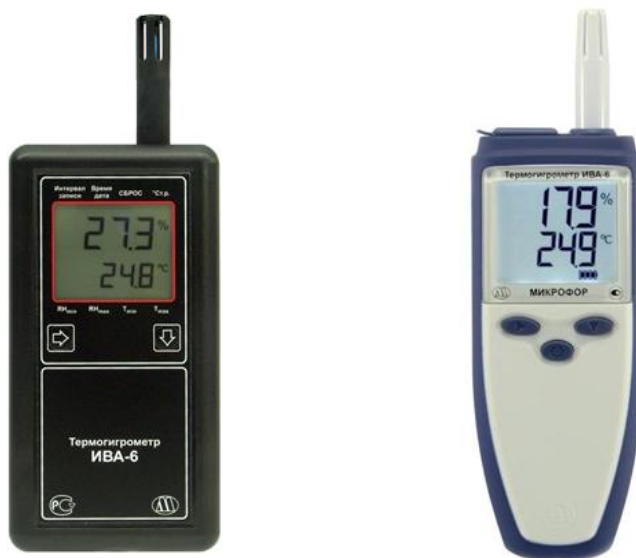
Рисунок 1 - Общий вид термогигрометров ИВА-6Н

Общий вид измерительных преобразователей различных модификаций представлен на рисунках 7-11.