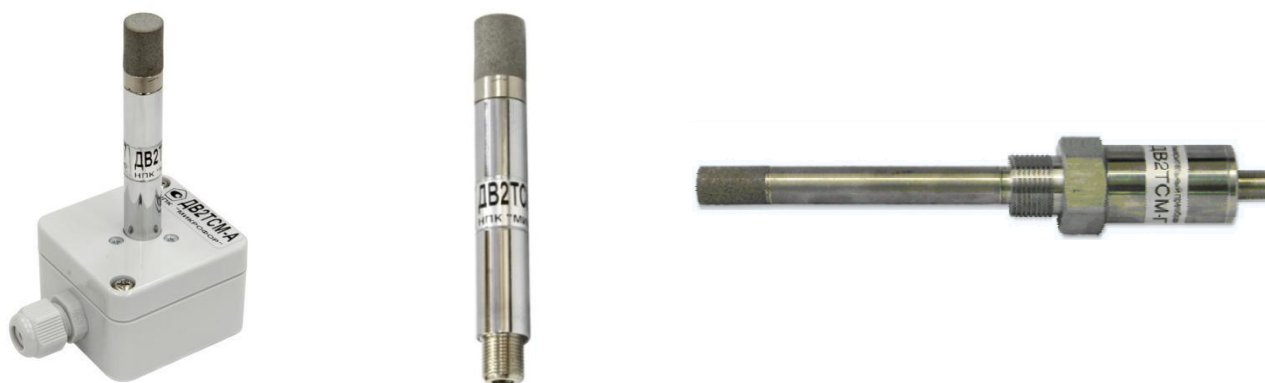
Рисунок 7 - Общий вид измерительных преобразователей ДВ2ТСМ в модификациях А, Б, ГМ (слева направо)