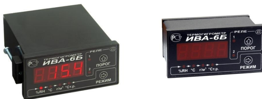
Рисунок 5 - Общий вид блоков индикации термогигрометров ИВА-6Б и ИВА-6Б-К