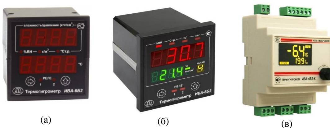
Рисунок 6 - Общий вид блоков индикации термогигрометров ИВА-6Б2 и ИВА-6Б2-К, (а), (б) - блоки индикации в щитовом исполнении, (в) – блок индикации в исполнении для монтажа на DIN-рейку