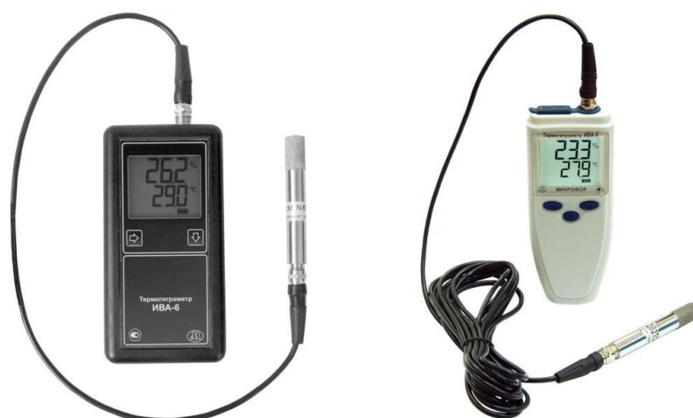
Рисунок 3 - Общий вид термогигрометров ИВА-6АР с измерительным преобразователем ДВ2ТСМ-Б